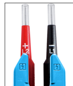
Pointes de touche IP2X (2mm et 4mm)