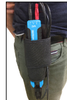
SC523 Etui ceinture